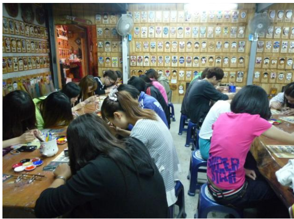
同學認真 DIY ，完成作品

認識完各種臉譜的意義後，立刻實際動手彩繪，讓印象更加地深刻。山板樵準備已裁好的木頭供大家彩繪。彩繪看起來雖然簡單，但一筆一劃都要小心勾勒、也可以發揮巧思加入自己的創意，讓小小的木雕變身為獨一無二的藝術品。看到大家小心翼翼的描繪自己的作品，用心地將它烘乾、上漆，這樣用心的迷人時刻，真讓人讚嘆「認真的男人/女人，最帥/美！」